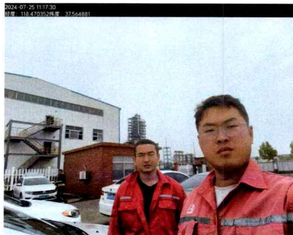
图 2 检测照片